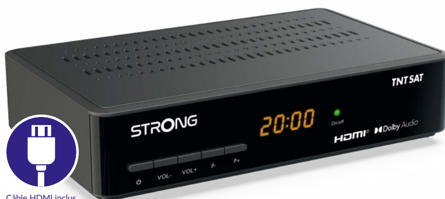
Câble HDMI inclus